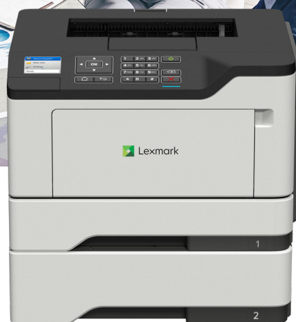
MS521dn con vassoio opzionale