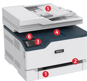
Stampante multifunzione a colori Xerox® C235