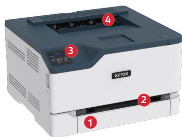
Stampante a colori Xerox® C230